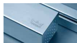
Technique de porte

Ferme-portes à glissière, DORMA Schweiz, F. 05/10