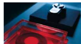
Sécurité Temps et Accès