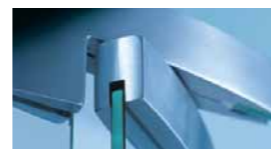
Solutions Architecturales du Verre